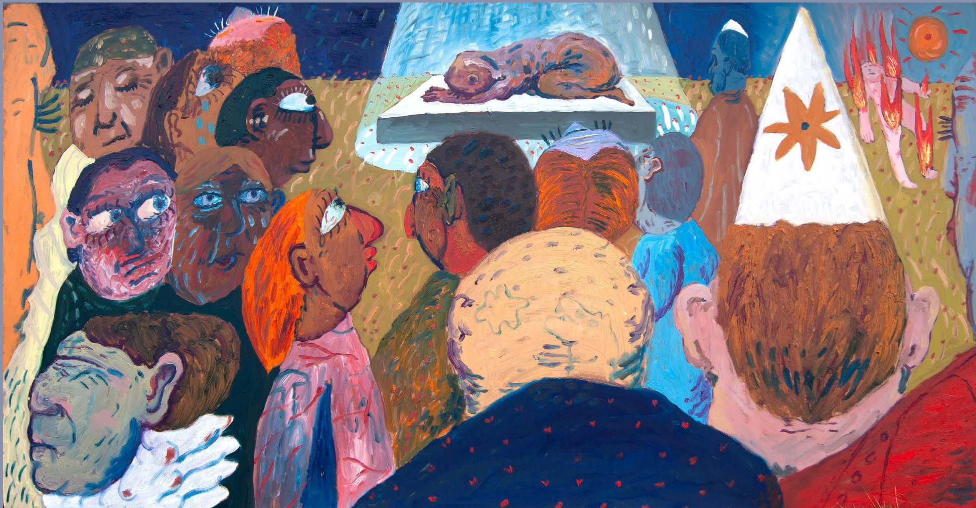
Performance Olja på trä 124x65cm 2025