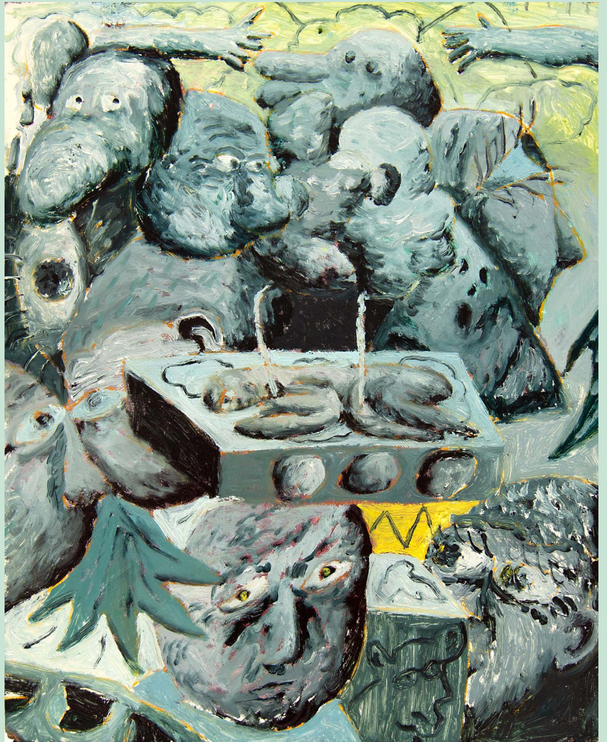
stone slabs Olja på trä 63x50cm 2024