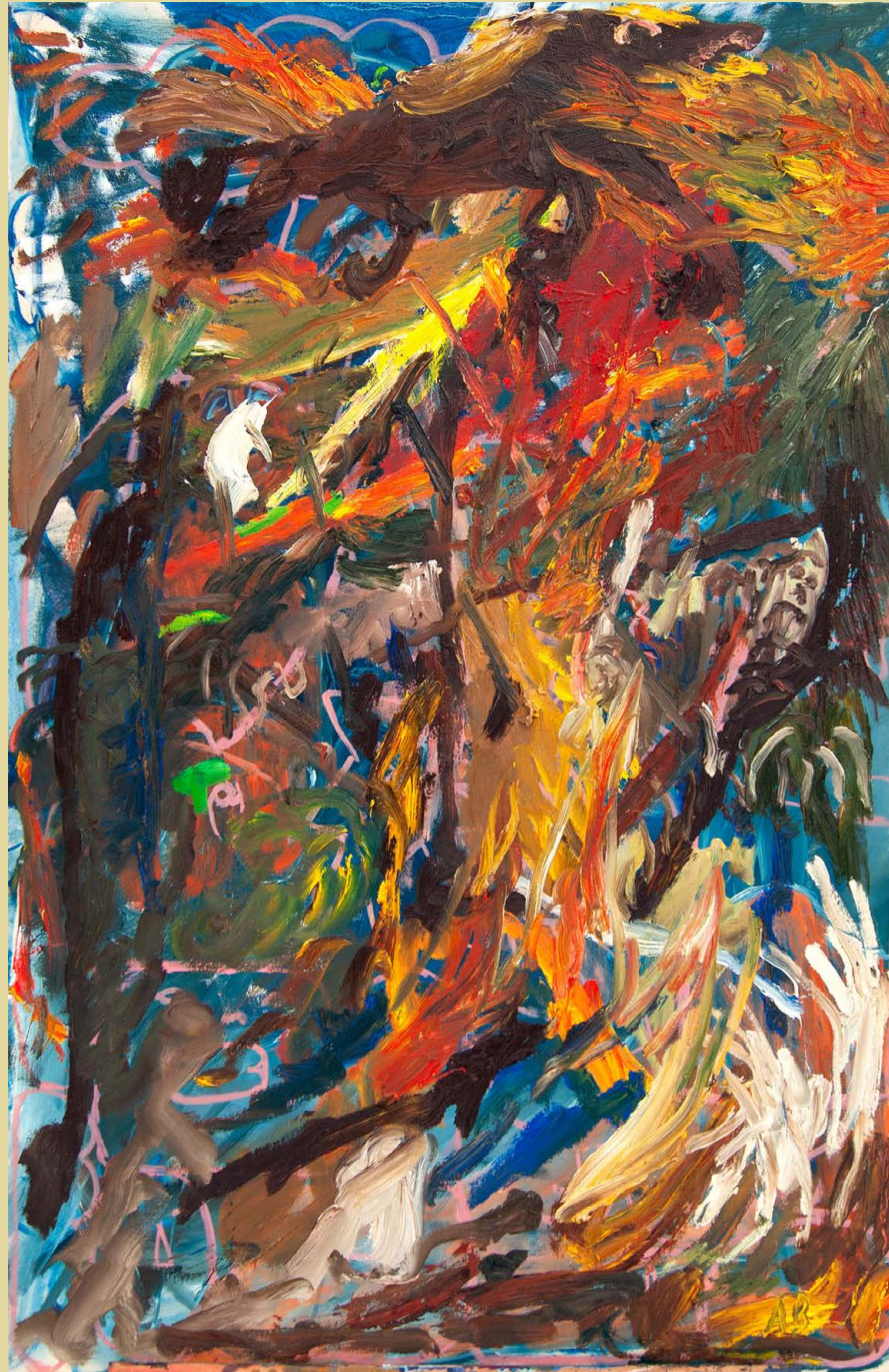
Burning Down the Horse Olja på trä 100x65cm 2024