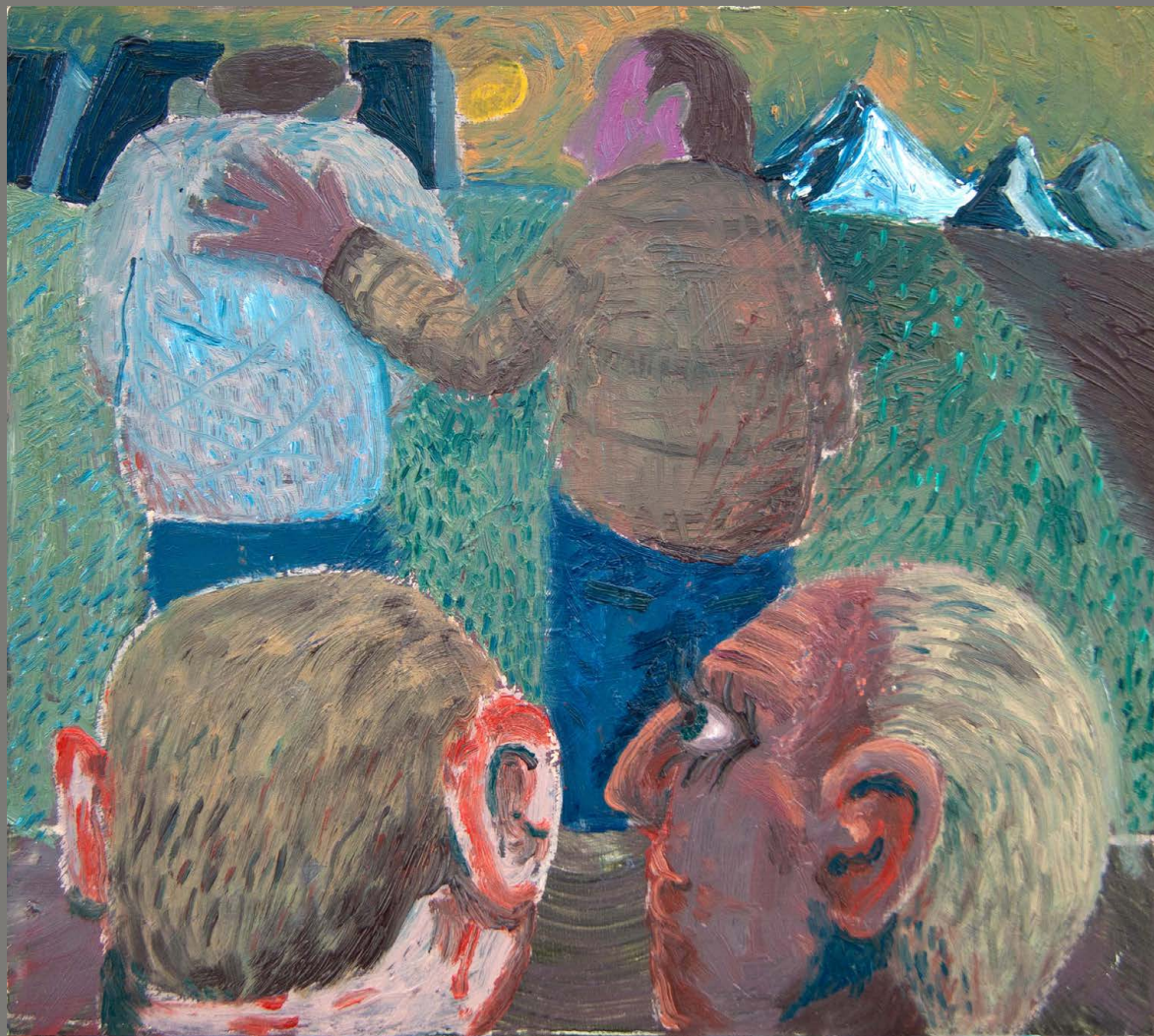
Comfort Olja på trä 38x33cm 2024