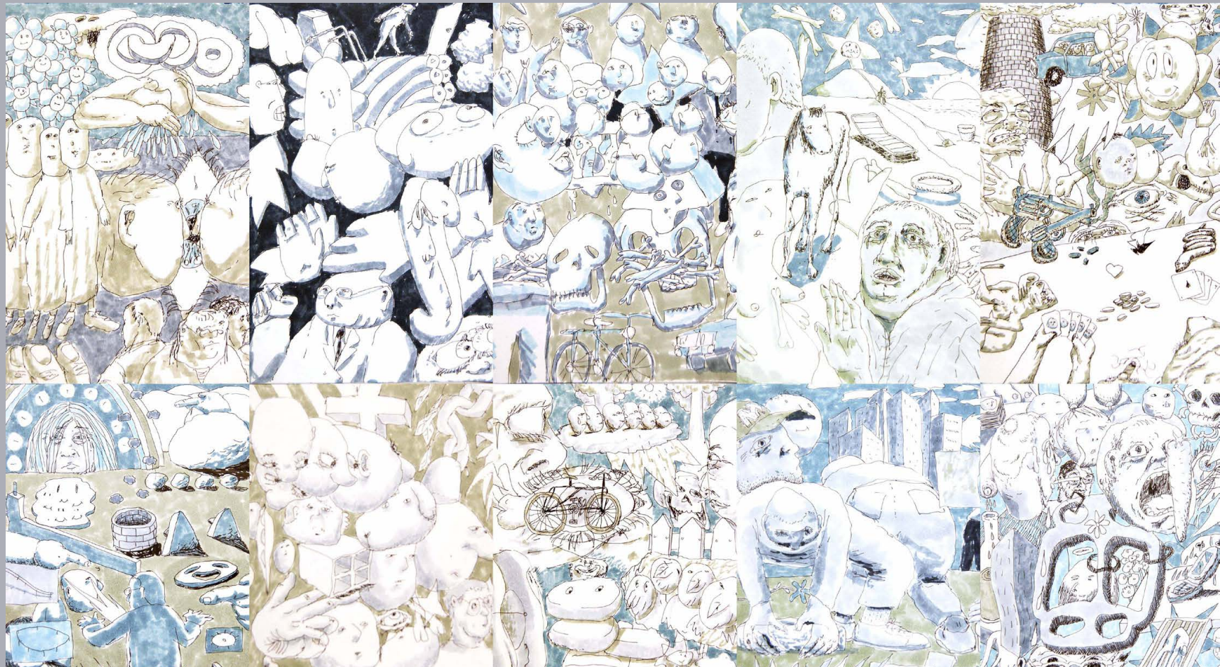
Daily drawings Tusch på papper A4 x 10 2024